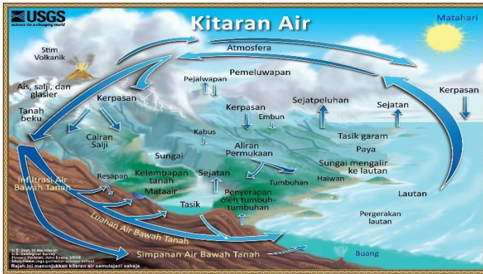
Rajah 2: Kitaran air semulajadi di bumi (United States Geological Survey, 2017).

air tersebut cukup mendalam. Air bawah tanah diserap oleh tumbuhan dan sebahagiannya meresap ke dalam tasik dan sungai. Selain itu, air bawah tanah juga boleh mengalir keluar sebagai mata air ke permukaan. Air bawah tanah ini juga akan mengalir semula ke lautan bagi memastikan kitaran air bumi terus berjalan. Rajah 2 menunjukkan kitaran air semulajadi yang berlaku di bumi.